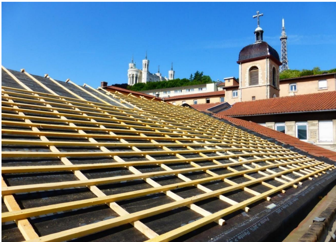
Restauration de la toiture, 2016